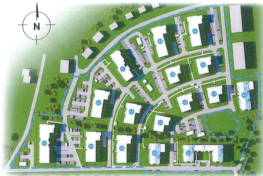
Rysunek 2. Plan inwestycji Królewskie Tarasy w Wieliczce wraz z drogami dojazdowymi do osiedla.